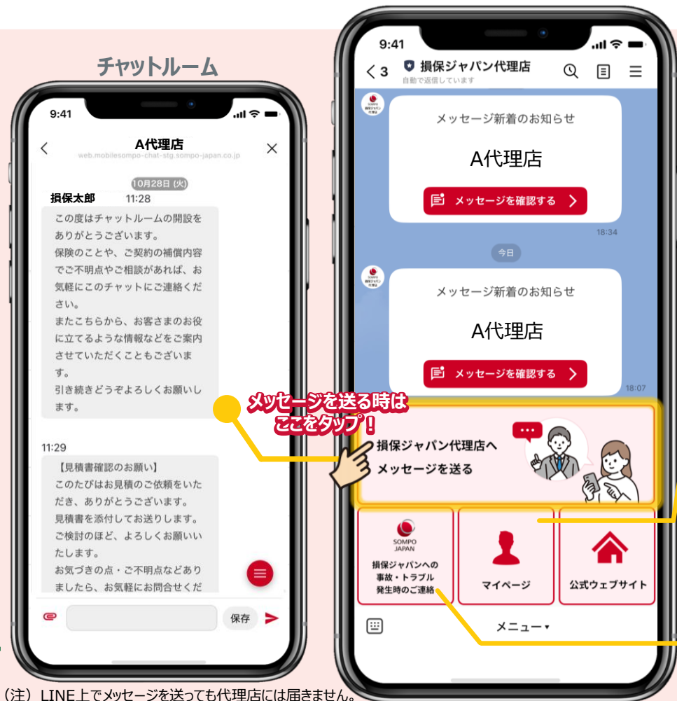
(注) LINE上でメッセージを送っても代理店には届きません。